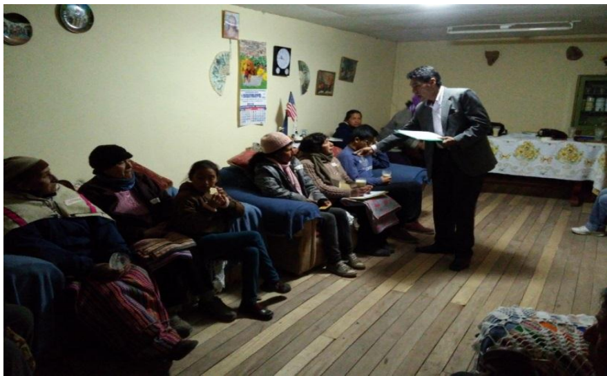
VISITAS PARCELAS Y ENTREVISTAS EN PROFUNDIDAD